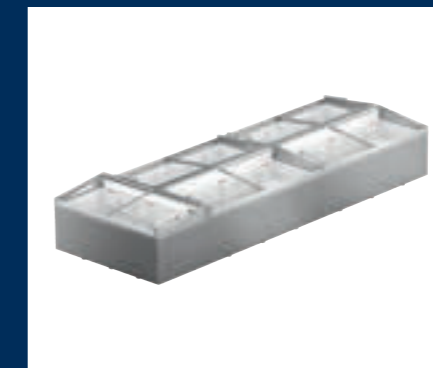
Eiland met een eindvriezer