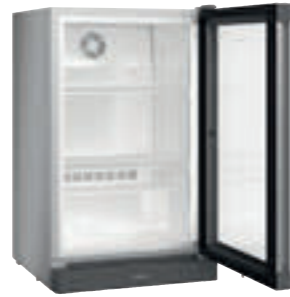
BCv 1103 Premium