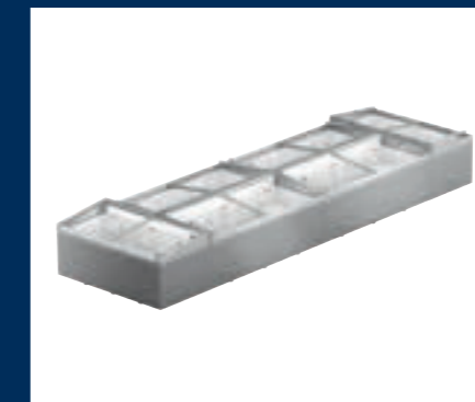
Eiland met twee eindvriezers